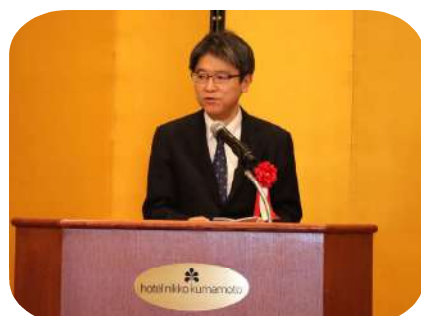
熊本県警察本部長 宮内彰久 様