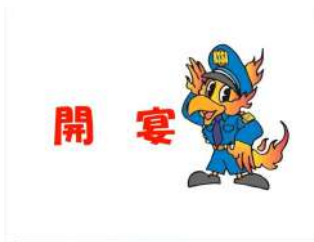
オープニングDVD映像の一部