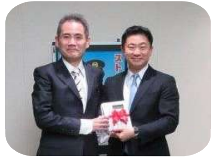
左：岸田県警本部長 右：西川社長

熊本県内における電話でお金詐欺の被害は、昨年 1 年間で認知件数 41 件（前年比 - 31 件）、被害総額約 4,936 万円（前年比 - 約 8,174 万円）、本年も 2 月末時点で、認知件数 5 件（前年同期比 - 2 件）、被害総額約 3,161 万円（前年同期比 + 2,310 万円）となっています。