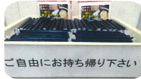
警備員募集用ティッシュ