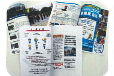
警備会社案内 (本文)