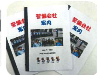
警備会社案内 (表紙)